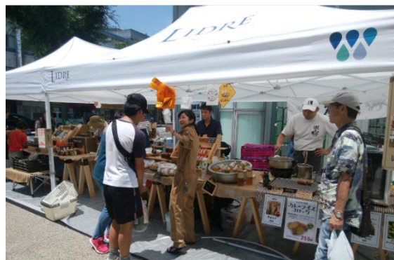
土曜マルシェ；横須賀中央駅近くのりドレ横須賀の歩行者天国にて