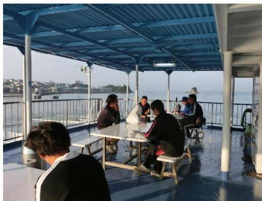
農作業に向かう船上の若手農業者