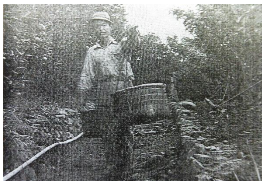
天秤棒で運搬していたころ