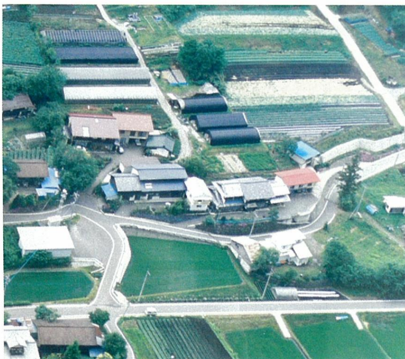
丸山家の航空写真